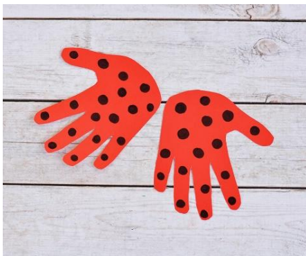
Slika 2. Ocrtavanje i bojenje šake

Preuzeto i izmijenjeno prema: https://www.iheartartscrafts.com/recycled-cd-ladybug-kid-craft/ (Pristupljeno, 2.5.2020.)