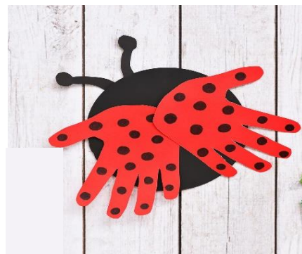
Slika 3. Bubamara s krilima